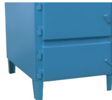
BKp-63 (80) кВт