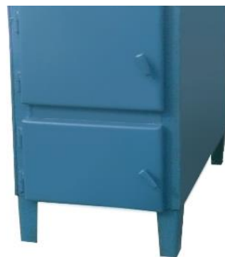
KBp-31,5 (40) кВт